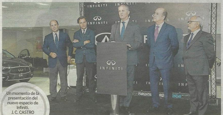
Un momento de la presentación del nuevo espacio de Infiniti.